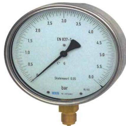
Feinmessausführung Typ 312.20